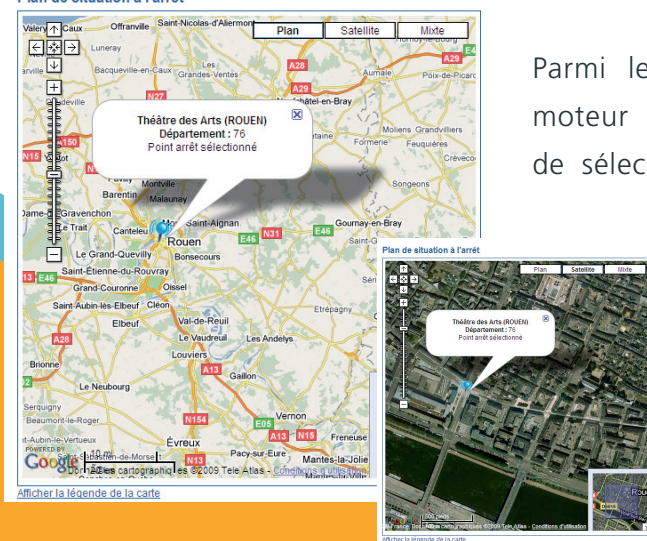
Plan de situation à l'arrêt

Parmi les différentes options proposées, le nouveau moteur de recherche d'itinéraires permet désormais de sélectionner un mode de transport comme option complémentaire (métro, TEOR, bus ou taxibus), afin de répondre au mieux aux habitudes de déplacements des voyageurs.